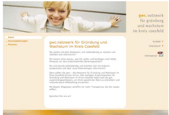
gwc.netzwerk für Gründung und Wachstum: Wertvolle Infos auf der Website

„Netz“: Die Website www.gwc-netzwerk.de gibt einen Überblick über die möglichen Anlaufstellen vor, während und nach der Gründung. Sie enthält zudem die Kontaktdaten der einzelnen Netzwerkmitglieder, Informationen über deren jeweilige Funktion im Gründungsprozess, die Namen der persönlichen Ansprechpartner sowie einen gemeinsamen Veranstaltungskalender.