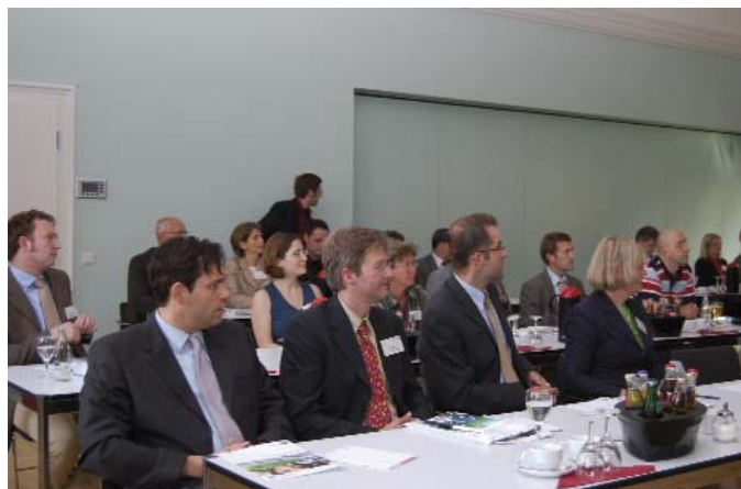
⤴ Fördergelder im Blickfeld: Die Teilnehmer der Informationsveranstaltung zum Wettbewerb Ernährung.NRW erhielten guten Rat vor dem Bewerbungsstart.

Mit gutem Konzept und guten Argumenten hat der Kreis Coesfeld in Kooperation mit den Städten und Gemeinden, der Fachhochschule Münster und der wfc im vergangenen Jahr am Wettbewerb der NRW-Landesregierung zur Einrichtung neuer Fachhochschulorte in den MINT-Studiengängen teilgenommen. Kreisverwaltung und wfc hatten im Februar zum InnovationsIMPULS geladen, um die Ergebnisse einer Bedarfsanalyse vorzustellen. Auf dieser Veranstaltung haben viele der Teilnehmer den Wunsch nach einer wirtschaftsnahen Fachhochschule geäußert. Eine Reihe von Unternehmen sagte zu, das Projekt etwa durch Stiftungsprofessuren mitzufinanzieren. Die Landesregierung indes sagte ab. Gleichwohl sehen die Akteure im Kreis Coesfeld das Projekt nach wie vor als Ziel gemeinsamen Handelns. Damit ist klar: Die Fachhochschule bleibt im Fokus.