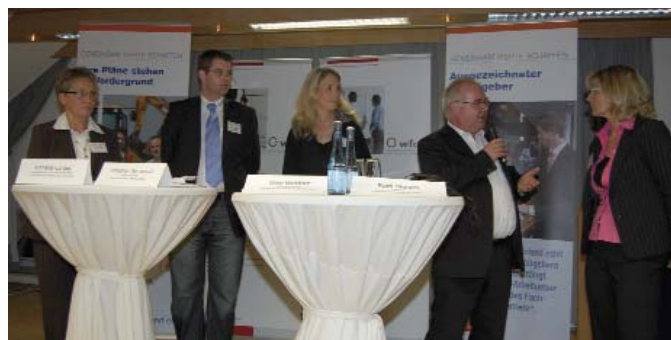
➤ Familienfreundlichkeit in der Fachdiskussion: Eine Veranstaltung der Reihe InnovationsIMPULS brachte FAMM in den Blickpunkt der Öffentlichkeit.

Viel vor Ort war FAMM durch die aktive Teilnahme an Veranstaltungen und durch die Unterstützung des Aufbaus lokaler Netzwerke. Auch überregional ist FAMM in Projekte eingebunden. Ein Beispiel gibt die Kooperation „Famcare“ mit dem Institut für Site und Facility Management an der Fachhochschule Münster; ein weiteres ist die Entwicklung eines Gütesiegels für familienfreundliche Unternehmen in Zusammenarbeit mit der Bertelsmann-Stiftung.